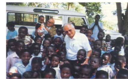
Padre John con alcuni bambini

Per maggiori informazioni vi invitiamo a consultare la "Guida per il sostenitore" disponibile sul nostro sito internet o a contattarci direttamente ai recapiti indicati.